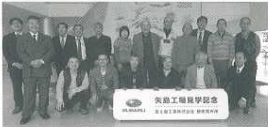
スバルビジターセンターにて

した影響は大きく、仕事がほぼ0になる事業所がある一方で、軽自動車シェア6%のスバルから、シェア30%のダイハツに取引先が代わり売上増を果たすことができた事業所もあるとのことでした。