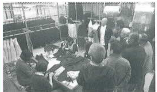
(株)辻洋装店工場の見学

時間が費やされていきました。見学後、質疑応答のほか、社長より業界への苦言や提言などお話しただき、また最も重視している人づくりについて独自の考えをお伺いすることができました。