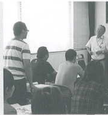
昨年の実習生講習風景