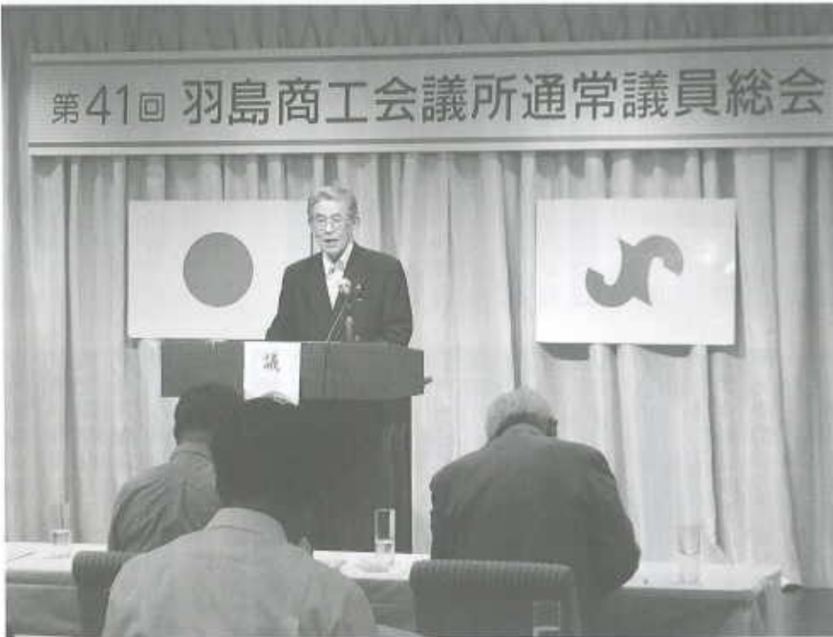
第41回 羽島商工会議所通常議員総会

6月29日(月)、アンディアーモ パルテンツアホテルにおいて、第41回通常議員総会を開催しました。 第1号議案 平成26年度事業報告、第2号議案 収支決算報告、第3号議案 定款の一部改正 についてそれぞれご審議をいただき原案通り承認されました。 詳細については、本号2ページをご覧ください。