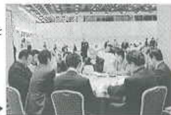
グループ交流会の模様▶