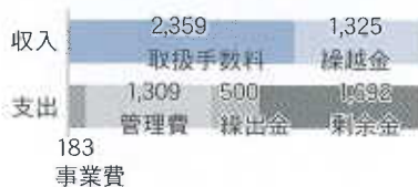
共済事業特別会計 (決算額 3,684千円)