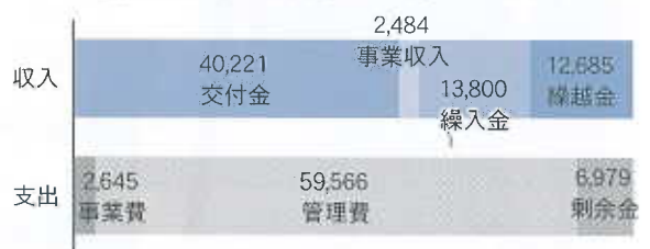
中小企業相談所特別会計 (決算額 69,190千円)