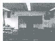
研修室 約60人収容 (116.58 m 2 )