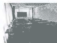
青年部研修室 約20人収容 (38.25 m 2 )