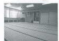
婦人部研修室 (和室) 約54人収容 (61.32 m 2 )