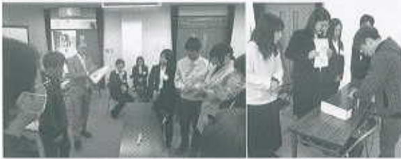
ローリーズストーリーキューブス発表 ジェンガを使ったチームプレイ