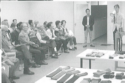
ヤマヤ(株) 野村社長から説明を受ける