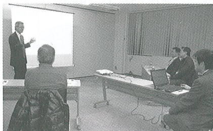
東京電力本社での研修の様子

長として陣頭指揮を執っていました。震災後、大きな余震が連続して起きる中、生命の危険、不眠不休の疲労、食料や水の不足、原子力発電所内の予測不能な状況といった極限的な環境の中、限られた時間、情報を元に意思決定し、作業することは想像を絶するものだったと語られました。