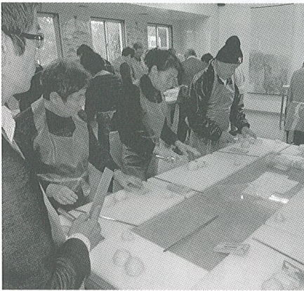
手作りかまぼこ体験の様子

参加者は、すり身を刃の無い「つけ包丁」でかまぼこ板に乗せて半円形のかまぼこを作りましたが、簡単