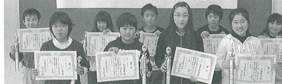
5・6年生の部 入賞者の皆さん