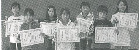
4年生以下の部 入賞者の皆さん