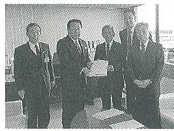
長谷会頭から市長に要望書を提出

ずまつりに対する市補助助定率（2分の1）方式から定額方式への転換、②空き店舗対策要件緩和の2点。その後、市長から市政についての説明等をお話いただきました。 11月1日から当商工会議所が新体制になって初めて行われた懇談会で、大変有意義な話し合いが生まれました。