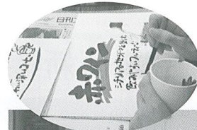
POP広告の実践のようす

本講習会では、今後の消費税税率引上げに備え、低コストで売上アップにつながるよう、毛筆とマーカーを使用した魅力ある広告づくりについて学びました。