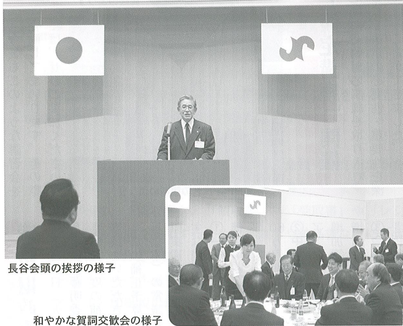
長谷会頭の挨拶の様子