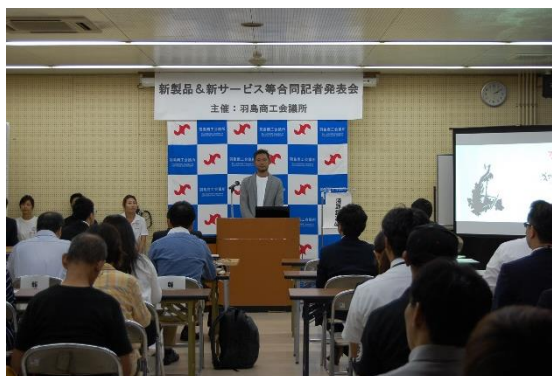
■ 昨年度の合同記者発表会の様子

※本資料は8月17日(月)羽島市役所内の記者クラブにて情報発信させていただきます。