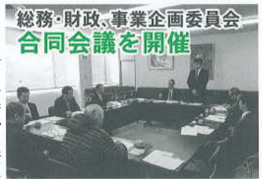
総務・財政、事業企画委員会 合同会議を開催

来年度については、商工会議所の事業運営及び産業振興の一環として、企業の人材育成・人材の確保対策等の施策を考えていきたい」との回答をいただきました。 事業運営につきましては、市担当部と協議して進めてまいります。 なお、会員の皆様には、事業内容を随時ご案内いたしますので、ご協力等を願います。