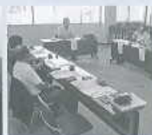
繊維加工・卸部会