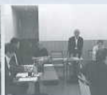
飲食・サービス部会