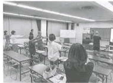
ビジネスプランの発表会

地域の活性化・雇用の確保をめざした特定創業支援事業『はしま創業塾』が終了しました。