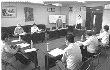
一般商業部会 (令和3年6月21日)

昨年に引き続き、新型コロナウイルス感染症拡大防止のため、マスコミ・関係者の方のみの参加とさせていただきます。当日は、動画撮影・ライブ配信を行いますので、オンラインで視聴が可能です。(URLは、当日に羽島商工会議所ホームページに掲載します。)