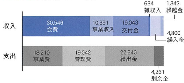
一般会計 (決算額: 63,756千円)