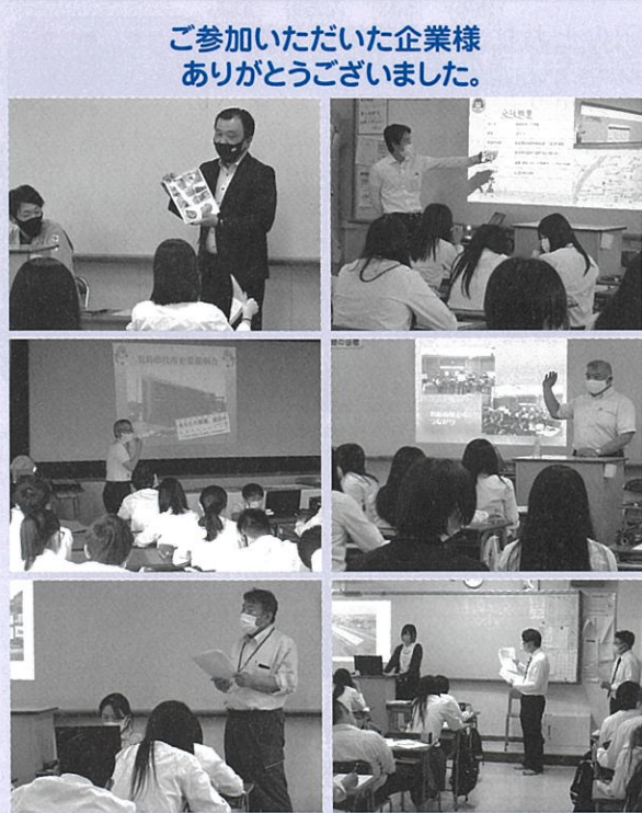
ご参加いただいた企業様 ありがとうございました。

本所では、羽島市内企業への人材確保事業を実施いたしております。 6月16日(水)、県立羽島高等学校にて、同校三年生の生徒約150名を対象に、市内企業の紹介とPRを目的とした出張企業説明会を行いました。 今回は(株)川瀬組、(福)万灯会(障害者支援施設)、羽島学園(昭和建设(株)、(株)北川工務店、ペットセラモニアの杜、羽島市役所にご参加頂きました。 各企業等の担当者の方々は、1クラス15分程度の時は、