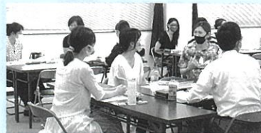
互いのビジネスモデル図を語り合い、創業のイメージを膨らませる参加者