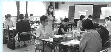
グループでSDGsについて話し合う参加者