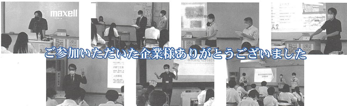
ご参加いただいた企業様ありがとうございました