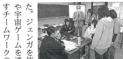
ジェンガを使ったグループワーク

制限のない日常が戻る今、好きなこ とや挑戦したいことを全力楽しんで いただきたいと思えます。 羽島商工会議所は皆様のご活躍を 応援します。