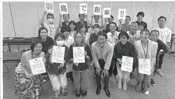
修了証書を手創業への第一歩を踏み出した参加者

申込者数…25名 平均出席者…21.4名 のべ150名 出席率…85.7% 修了証発行数…23部