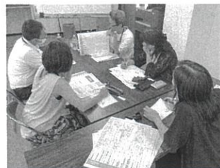
グループでビジネスプランを話し合う

いて、ポイントやコツを紹介していただき、これから創業される方にとって目指したいベストプラクティスであり、さらに役立つ情報をたくさん得たことで自信になりました。続く3回は戦略マップやビジネスプランを作成しました。