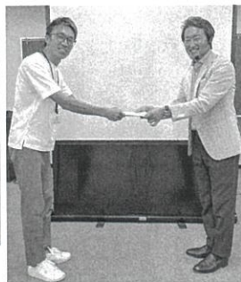
伊藤先生より修了証書授与