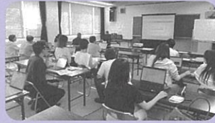
R7.9月～10月 ペライチでHP作成