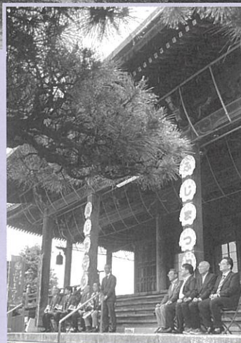
ふじまつり開花セレモニー