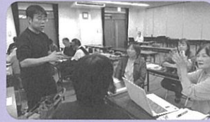
R7.9月 生成AI活用セミナー