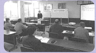
R8.1月 事業承継セミナー