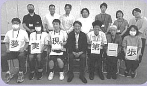
R7.7月～8月 はしま創業塾