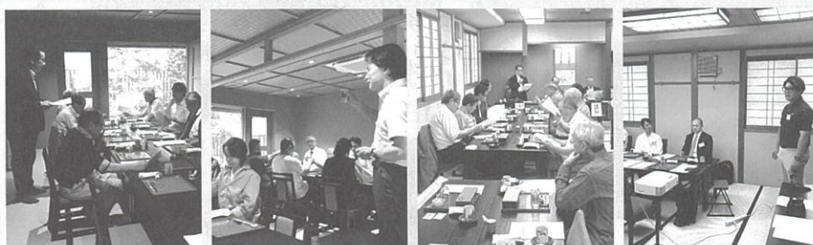
繊維加工・卸部会総会 6月22日

各部会・青年部が役員会・総会を行い、今年度の部会等活動が本格的に始動いたしました。 今年度の事業内容について検討し、行事の開催等が決定いたしましたら、その際には各部会等よりご連絡いたします。