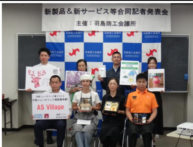
■前回の合同記者発表会の様子