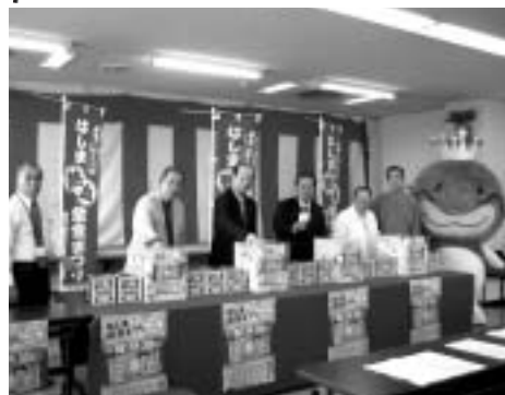
第1回の抽選会の様子