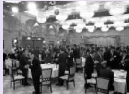
新春賀詞交歓会の様子

会場のみならずこちらで新年のあいさつを交わす光景が見られ、終始和やかな雰囲気で行われました。