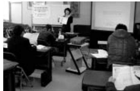
熱心に研修を受ける参加者

者が理解すること」、「基本理念や対象とする客層などの経営戦略を持って運営すること」等が大切で、一担当者だけに任せ切りにしないことを説明されました。参加された方は、研修内容に「気づき」、今後の経営に役立てて頂ける事と思えます。 (日本商工会議所、NPO