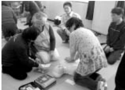
心肺蘇生法の実習を受ける受講者

まず、救急隊員から応急 手当の目的・必要性を座学 で学び、その後、実技でA EDの使い方、心肺蘇生法 や異物の除去法、回復体位