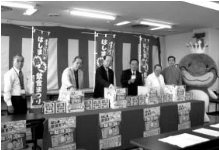
第1回の抽選会の様子

また、期間中に参加協力店にてお食事・ご購入された方の中から15人以上に参加店で使える商品券1万円分、さらに商品券2千円分が各店から