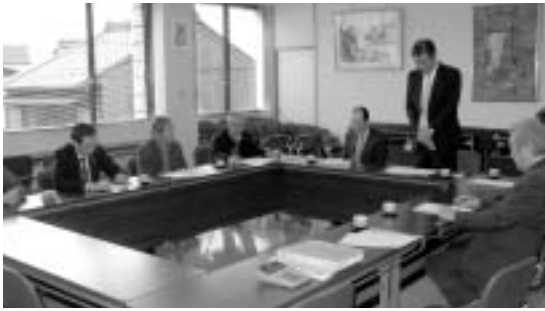
総務・財政委員会の様子

事業計画と予算（案）は、常議員会を経て、3月28日開催の通常議員総会にて正式に決定されることとなります。