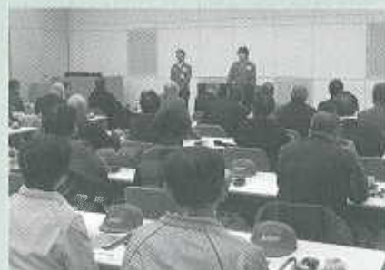
三菱電機中津川製作所にて研修の様子

最初に三菱電機中津川製作所にて、第一工場の産業扇組立ライン、第二工場の業務用ロスナイ(熱交換機能付喚気装置)組立ライン、展示施設を視察して、当社の接客態度のすばらしさ、作業効率を良くするための整理整頓、職場環境に取組む姿勢など参考になったことが多くありました。