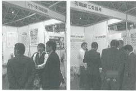
テクナード(株)ブース 幸栄テクノ(株)ブース

この展示会は、日本最大級異業種交流展示会で、当所のブースには、幸栄テクノ(株)(協力企業)・(株)ユタカ電子製作所、(株)イーエスピエ企画、プロジェクトジャパン(株)、テクナード(株)が