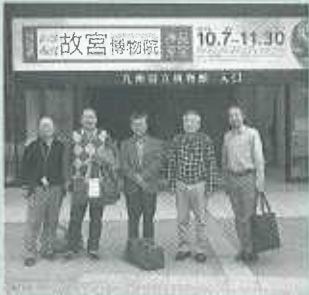
九州国立博物館にて

訪れ、串カツ屋が立ち並ぶ「ジャンジャン横丁」、今では珍しいスマートボール屋、囲碁将棋会館などここならではの昭和の雰囲気を感じてきました。皆はコテコテの大阪から活力を得る一日となりました。