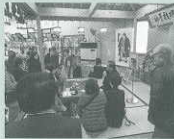
飯田の伝統工芸「水引」の実演。関取の髪結いに今も使用されている。

を見学しました。その後、予定を変更して「ふるさと水引工芸館」を訪ね、水引に関する展示や実演を見学し、羽島への帰路に着きました。