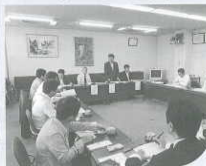
6月9日 金融・保険部会総会