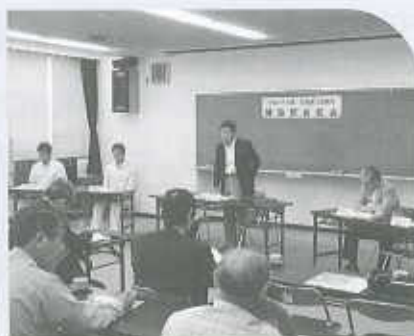
6月6日 建設部会総会