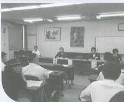
6月23日 青年部総会・勉強会