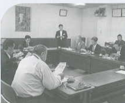
6月6日 運輸・通信部会総会